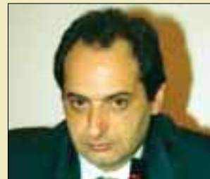
Ο Πρόεδρος του ΤΕΕ, Χρ. Σπίρτζης

Όταν πέφτουν οι μάσκες του “Τεχνικού Συμβούλου” και αποκαλύπτεται αυτό που είναι στην πραγματικότητα