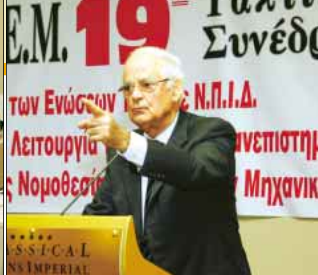
Ο τ. Πρόεδρος της Βουλής και Βουλευτής του ΠΑΣΟΚ, κ. Απ. Κακλαμάνης.