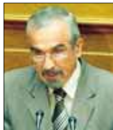
Ο Βουλευτής της Ν.Δ, κ. Νικ. Καντερές.

Μ όνο ως απαράδεκτη μπορεί να χαρακτηριστεί η προσπάθεια του Βουλευτή της Ν.Δ, κυρίου Νικόλαου Καντερέ, για υποβάθμιση του ακαδημαϊκού επιπέδου των Τ.Ε.Ι μέσω της επερώτησης που κατέθεσε στη Βουλή. Το θέμα της υπ' αριθ. 7469/08-12-2010 ερώτησης προς τον Υπουργό Εθνικής Άμυνας ήταν η ισοτιμία πτυχίου των Ανωτέρων Στρατιωτικών Σχολών Υπαξιωματικών (Α.Σ.Σ.Υ) με τα Τ.Ε.Ι!